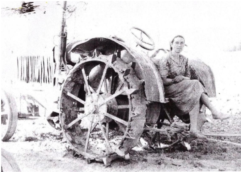
фото 2: Юлия Васильевна на тракторе (1940-е годы)