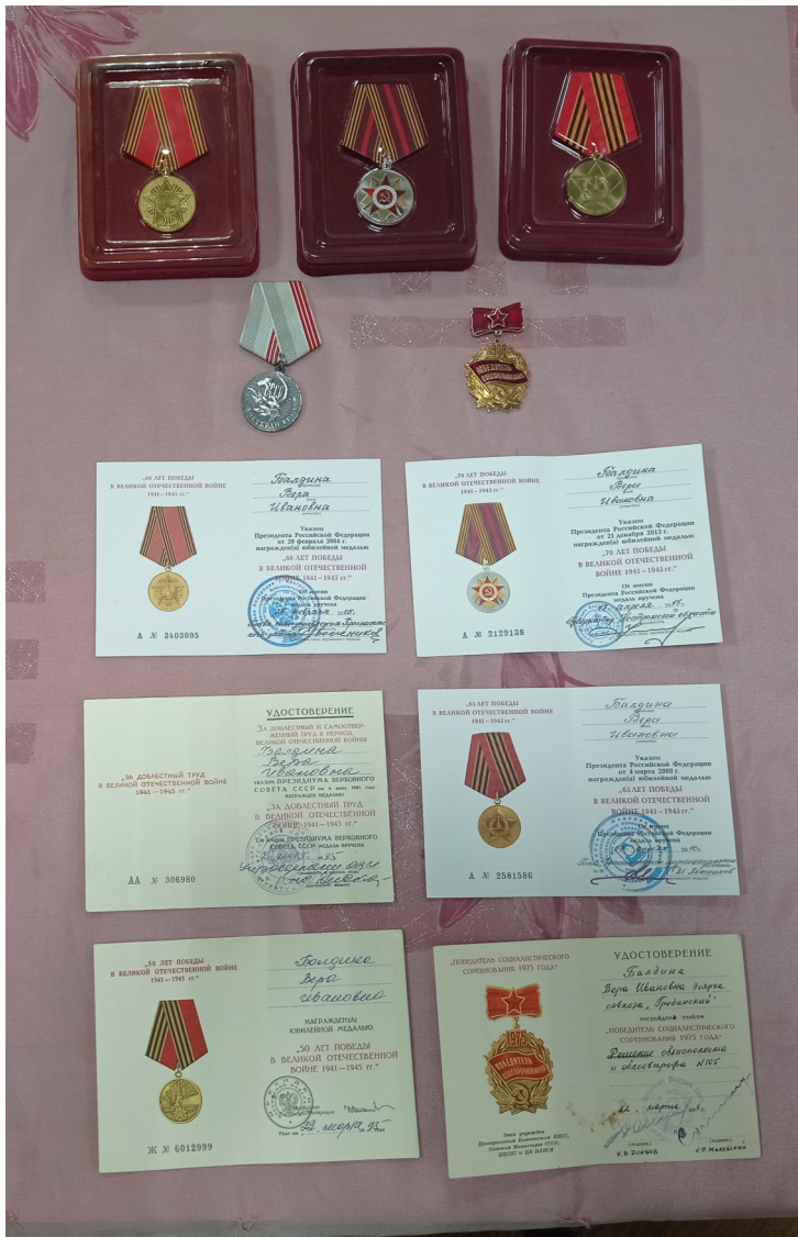
Награды Веры Ивановны.