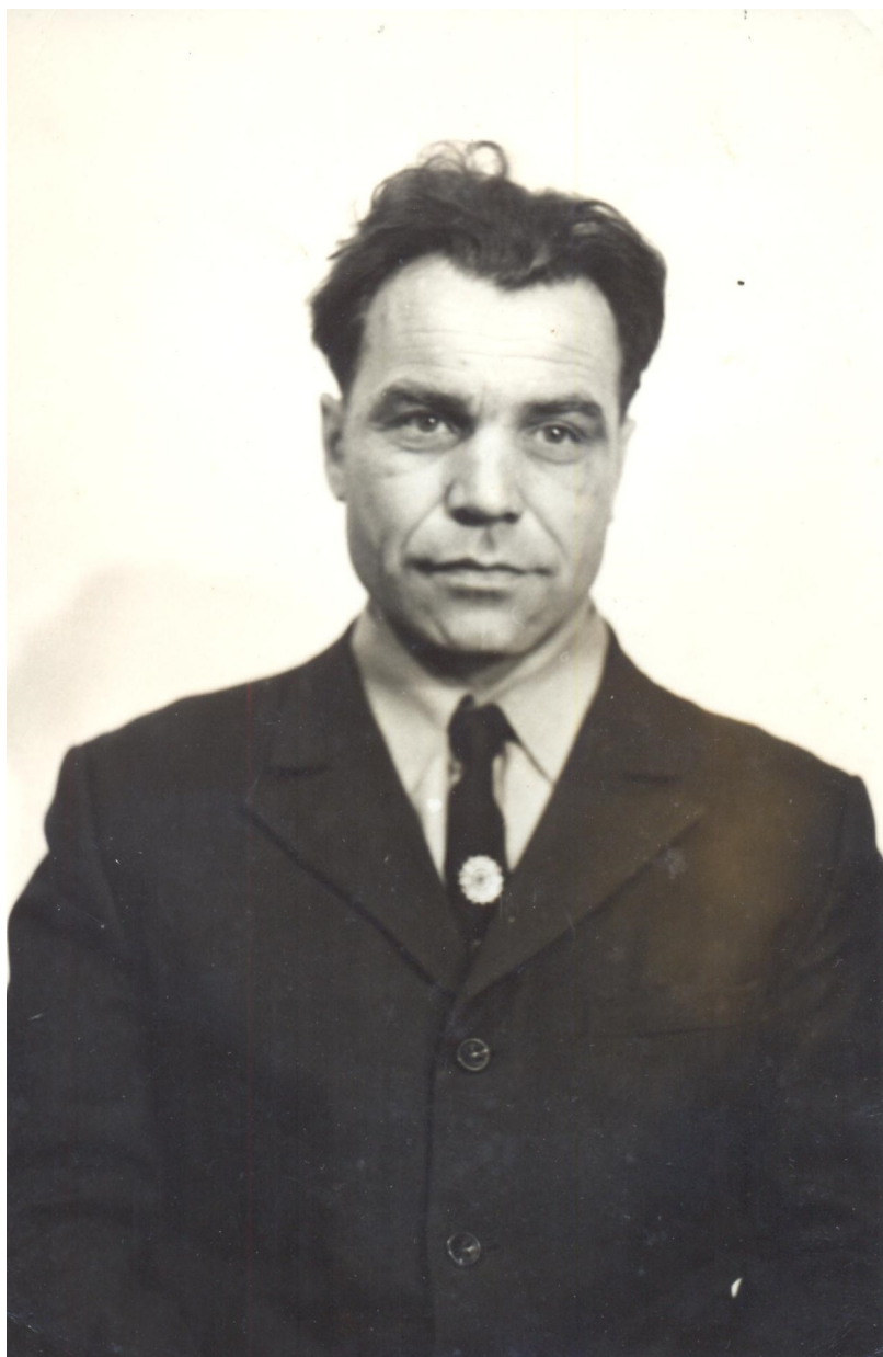
Фото 1980-е годы.