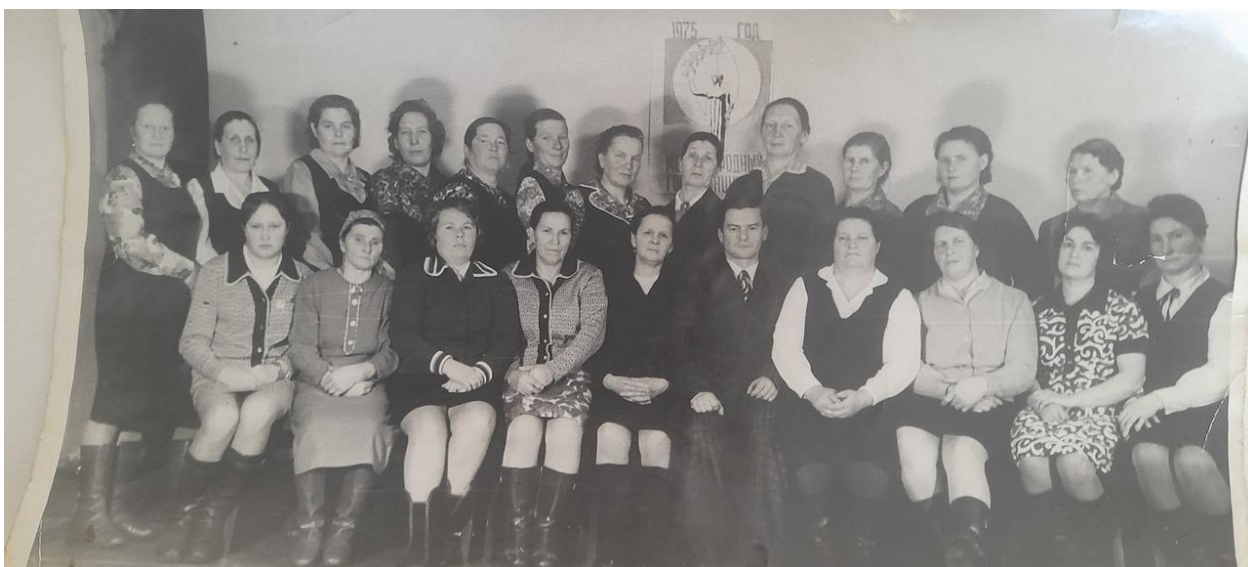
Коллектив колхоза «Родина»