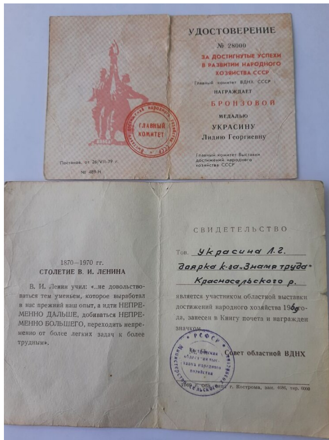
Удостоверение к бронзовой медали «За достигнутые успехи в развитии народного хозяйства СССР», 1979 год.